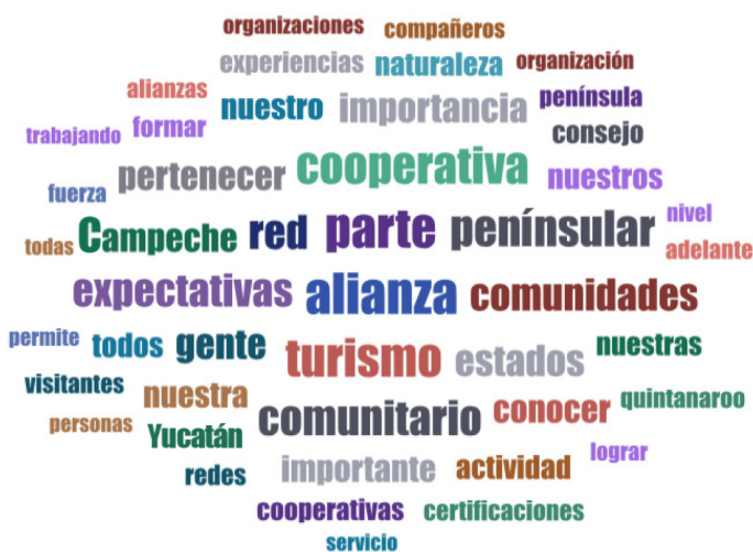
Figura 3. Nube de palabras recurrentes en los entrevistados de la APTC.

La formación de estas redes y alianzas responde a la necesidad de los socios de visibilizar sus iniciativas tanto con el mercado como con el estado. Por ejemplo, los socios de la APTC mencionaron con recurrencia palabras como cooperativa , alianza , comunidades , comunitario (véase fig. 3), representando esta voluntad de escalar su organización a otro nivel, no solamente para darla a conocer, sino también para incidir en las políticas públicas.