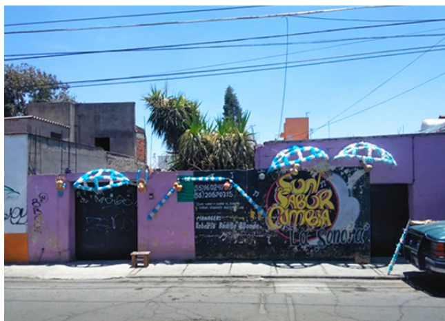
Figura 3. Elementos utilizados en la danza de los serranos que decoran la fachada de una casa. Página de Facebook de Parroquia de Tepexpan, 3 de mayo de 2020.

no dieron la espalda al altar donde se encuentra el Señor de Gracias: salieron de reversa hasta la calle.