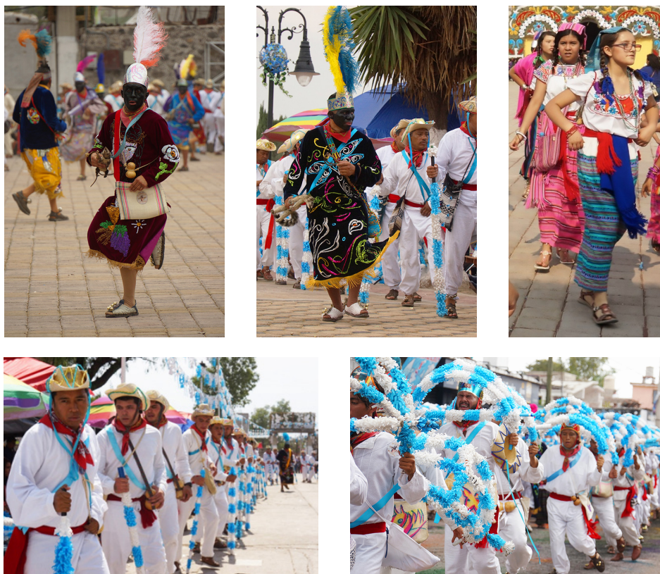
Figura 2. Integrantes de la danza de los serranos A : negro. B : negro y serranos. C : inditas. D y E : serranos.

Se puede considerar que la festividad del Señor de Gracias tiene tres momentos públicos importantes. El primero son los ensayos, que comienzan tres domingos antes del 3 de mayo a los que asiste aproximadamente un 25 % de danzantes, duran más de cinco horas y es el espacio donde los danzantes más experimentados transmiten, por medio del baile, el conocimiento a los menos experimentados.