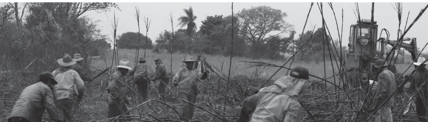
Zafra en Veracruz, México