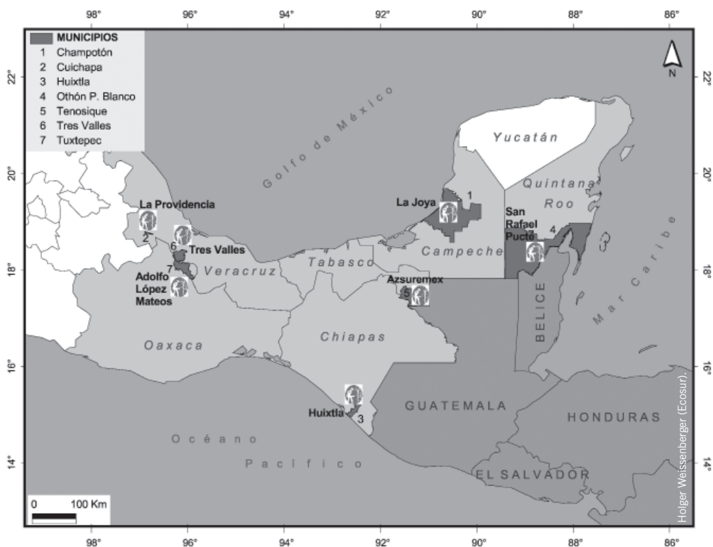
Mapa 1 - Ingenios y regiones cañeras del proyecto Jornaleros agrícolas de México y Centroamérica en los ingenios del sur-sureste: Retos para la política pública .

Nuestro interés es obtener una caracterización de esa población jornalera, el cuestionario dio el material necesario para conocer el perfil de esos trabajadores, elementos que fueron nutridos con los registros de campo (convivencia en galeras, campos de trabajo, lugares de origen, incorporación en las cuadrillas y cocineras), entrevistas y registros gráficos. Tras estas