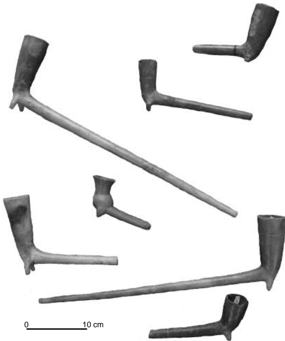
Foto 3 - Colección de pipas con un largo mango cilíndrico y recto, procedentes de Acámbaro y conservadas en el museo de esta ciudad.