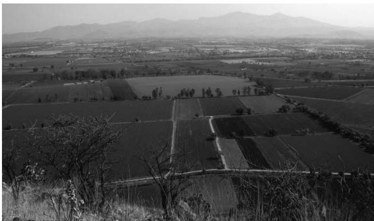
Foto 1 - Vista hacia los llanos de la zona tapón, desde el cerro El Chivo, sitio prehispánico de Acámbaro.