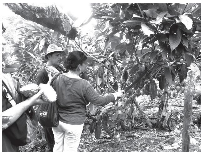
Foto 2. Comunidad Abdón Calderón. Una de las actividades de subsistencia principal es la agricultura de ciclo largo, el cacao es uno de los productos más comercializados por los pobladores.