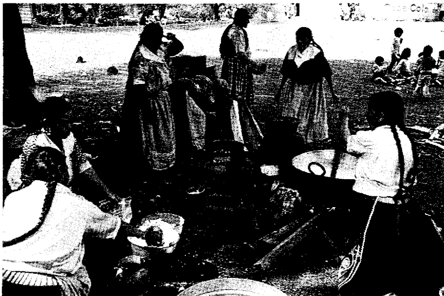
Foto 8 - Fiesta de la ropa de la Virgen.

Por Carl Lumholtz, quien visitó a San Juan Parangaricutiro en 1895, tenemos noticia de que en las inmediaciones del pueblo existían numerosas yácatas. Carl Lumholtz visitó en esa ocasión las yácatas de Panzingo.