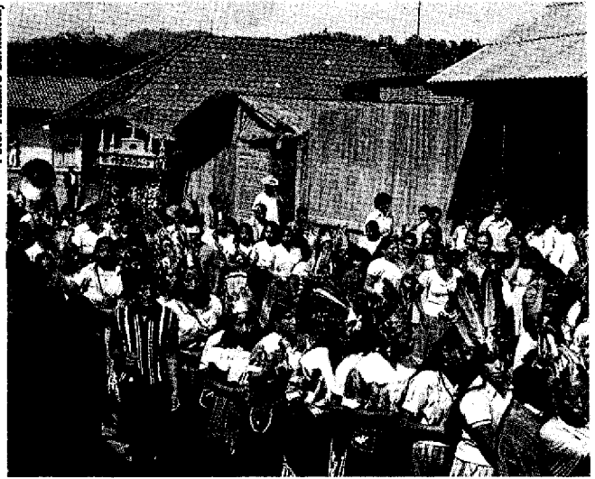
Foto 10 - La Catorci peregrinación en San Juan. El 14 de cada mes, los habitantes llevan una estatua de la iglesia a la casa de una familia que la recibe con velas y flores, y allí se queda un mes entero.

holtz hace referencia en sus escritos a unas campanas que se escuchaban en unas yácatas cerca de Cherán: