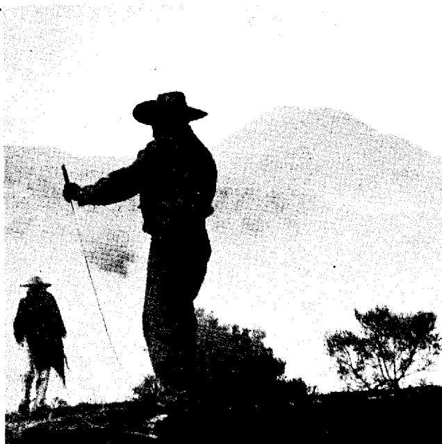
Foto 4 - Cohetón en Panzingo durante las ceremonias de la peregrinación que tiene lugar la primera semana de diciembre de cada año.

ca de los narradores y por el que no parece haber un interés especial. Por otra parte, los cuentos fabulosos se cuentan como experiencias graciosas y se sobreentiende que no son verdaderos. Son relatos que se inventan en cualquier momento y los argumentos no persisten en las memorias de la gente, por ello no se vuelven a repetir. Cada vez que se cuenta uno de estos relatos se asiste a un momento de invención personal, individual. Aunque forman parte de la tradición oral de San Juan no proliferan tanto ni tienen la misma importancia que los que se refieren a experiencias con lo sobrenatural. Por esas razones, tanto los mitos como los cuentos fabulosos salen del interés principal que aquí nos guía.