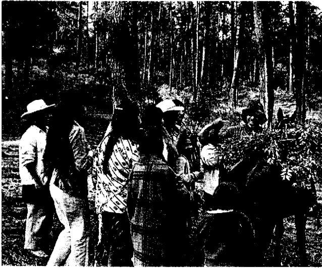
Foto 9 - El Nuriti de Panzingo es un menta utilizada como té, y crece cerca de las fuentes que brotan de la montaña.