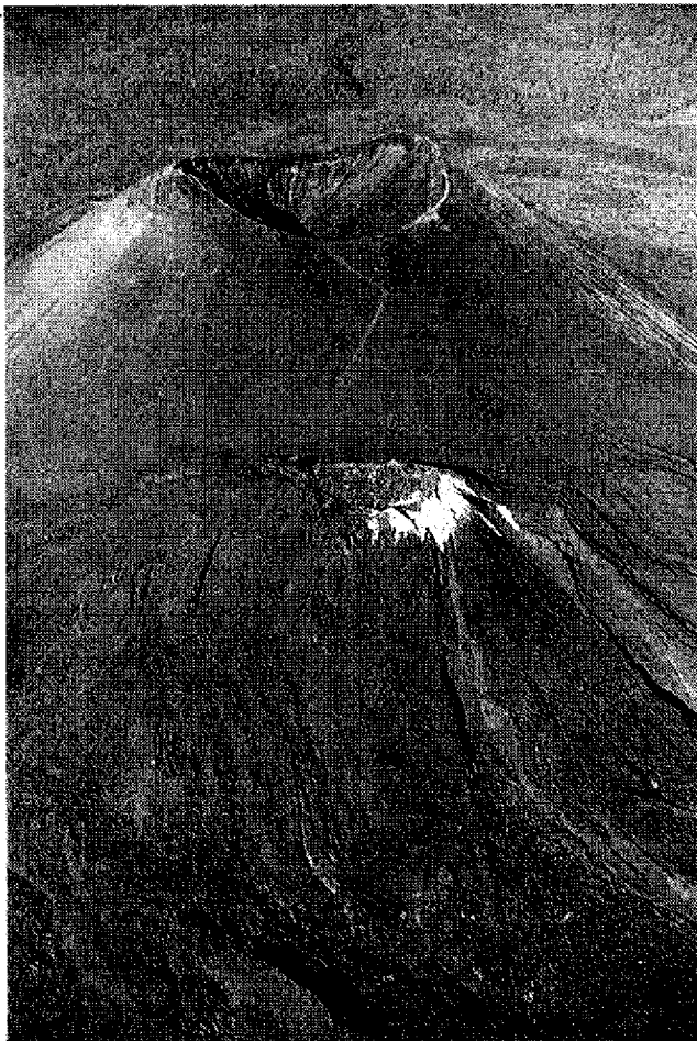
Foto 1 - El volcán parícutín, Michoacán.