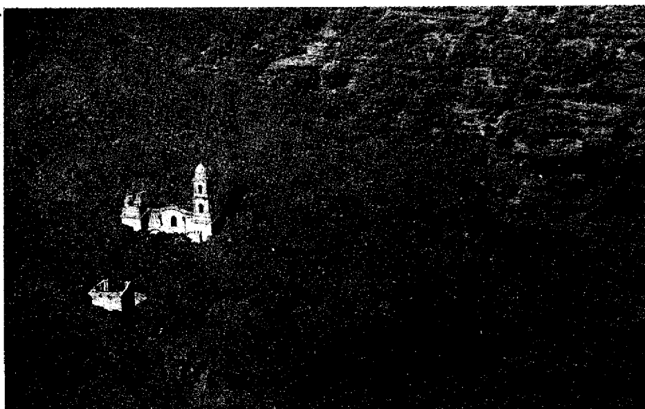
Foto 2 - Iglesia del Viejo San Juan en la lava.