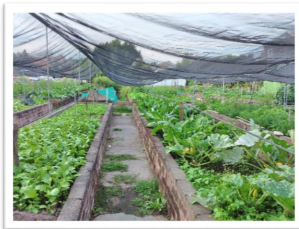
Figura 4. Huerto durante pandemia (julio, 2020)