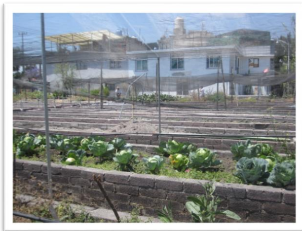
Figura 3. Huerto antes de Covid-19 (marzo, 2019)