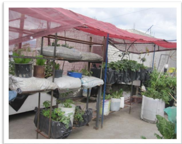
Figura 5. Huerto en Valle de Chalco antes de pandemia Covid-19, Izquierda (Enero, 2020). Figura 6. Huerto durante la pandemia, derecha (Julio, 2020).