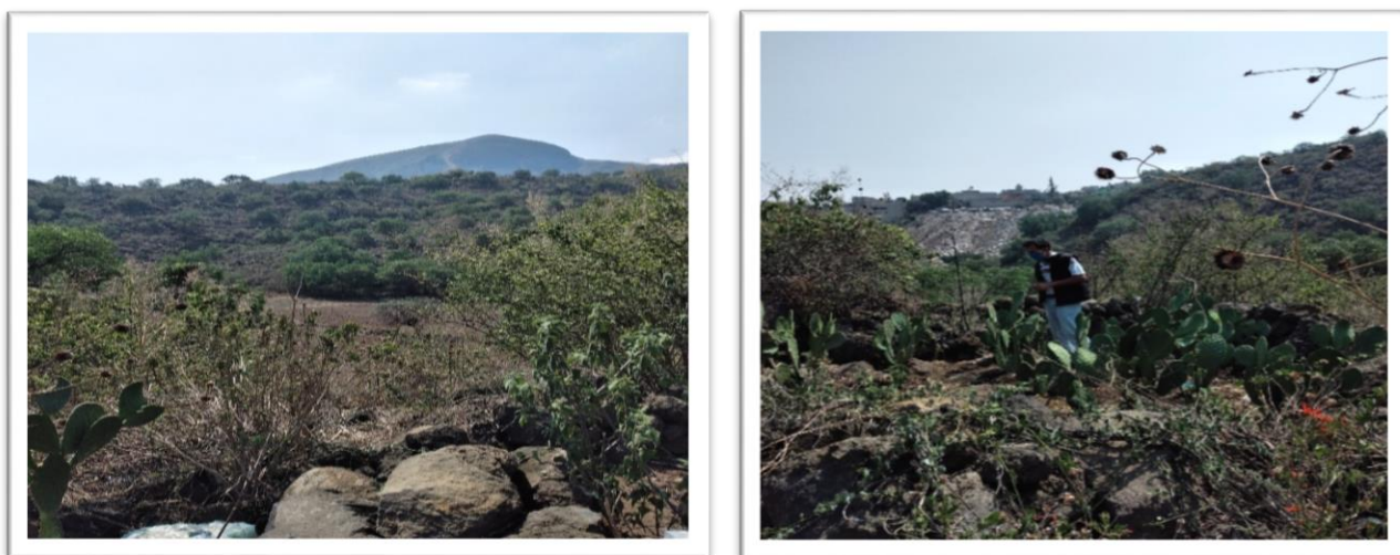
Figura 2. Terreno usado para la Agricultura en Sierra de Santa Catarina (Julio de 2020).