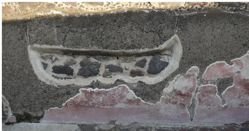
Figura 2. Muro Oeste, cuarto 12 a de Tetitla.

También, dentro de la profusa decoración que existe en los numerosos murales de Tetitla, los círculos rojos están presentes. En el cuarto 12a, tanto Miller como De la Fuente registraron cinco muros con el diseño de círculos en un “rojo claro sobre fondo rojo oscuro” (Miller, 1973: 156). De los cinco perviven actualmente parte de los diseños en el muro oeste, junto con la banda perimetral también en rosa (Figura 2). De los restantes muros, solo se aprecian secciones de la banda perimetral inferior en el muro norte y en el muro sureste, además de una sección de círculo, en éste último elemento. Dentro del material pictórico almacenado en el acervo del sitio arqueológico, tres fragmentos de pintura con soporte artificial (bastidor) tienen el mismo diseño, grandes círculos en rosa sobre fondo rojo oscuro, uno de ellos con una sección de la cenefa rosa que lo enmarcaba. De los tres fragmentos, dos de ellos se encuentran catalogados como “escena sin determinar” señalando el tercero, como procedente de Tetitla. 2