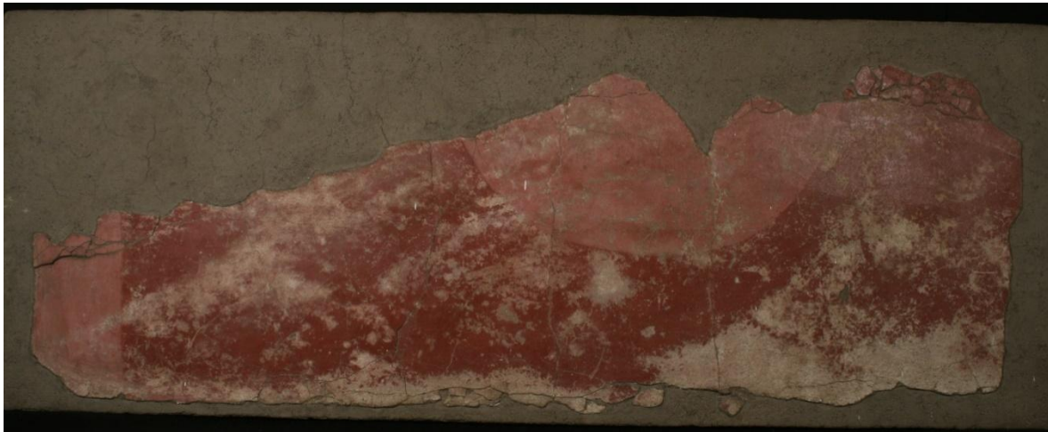
Figura 3. Mural en bastidor, Acervo arqueológico de la ZMAT.

En el conjunto de Zacuala, Laurette Sejourné realizó excavaciones extensivas entre los años 1955 a 1958. De estas temporadas de campo produjo su conocida publicación Un palacio en la ciudad de los dioses , donde reproduce en coloridas láminas la mayor parte de los murales encontrados. Llama la atención la referencia a “un pasaje rojo...ornado de grandes círculos de un rojo diferente al del fondo...están en número de cuatro” (Sejourné, 1959: 29) del cual solo realiza un registro gráfico esquematizado. La importancia de este gráfico es que la autora lo interpreta como la representación del sol y específicamente con la leyenda del quinto sol, ya que al final del pasaje se localizó una pintura de “hombre-tigre-pájaro-serpiente” o Quetzalcóatl rojo. Actualmente se pueden ver la parte inferior de estos círculos en las paredes de este corredor, pero también quedan restos del mismo diseño en el cuarto ubicado al oriente del mismo, donde se aprecia in situ lo que parecen ser las secciones inferiores de grandes círculos en color rosa, con secciones de cenefa en color rosa también, sobre un fondo rojo oscuro. Aunque este cuarto no fue registrado con decoración por la misma Sejourné, aún conserva vestigios de enlucido y capa pictórica bícroma en todos sus muros, siendo donde mejor se aprecian los restos del diseño de círculos en los muros este y oeste.