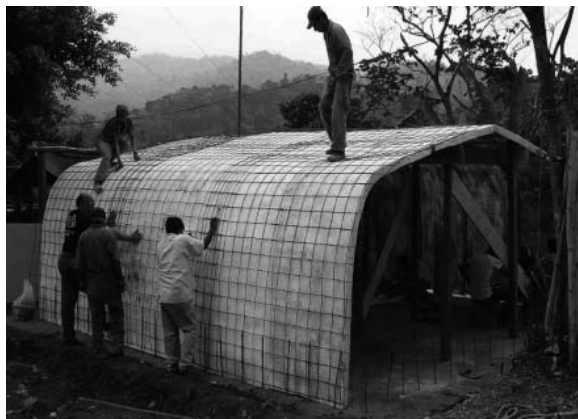
Figura 7 -Casa construida por Caritas Mexicana en Chiapas.

Los métodos de adaptación de las comunidades a los riesgos son generalmente considerados demasiado primitivos, ineficaces, para poder enfrentar las situaciones de riesgo. Los Pueblos de Morelos en su manifiesto del 2007 5 escriben lo siguiente: “Relacionados con nuestra madre tierra aprendimos a leer la niebla, el frío y el calor, los temblores ligeros de la tierra y los eclipses; aprendimos a interpretar el sonido de nuestros ríos y a dialogar con el viento que sale de los pozos naturales y los ríos subterráneos. Conversando con el monte, con la lluvia, con las nubes, con el sol y con los seres que viven en nuestro territorio hemos aprendido a entender nuestros lugares, sus manifestaciones, sus fenómenos naturales y desde ahí planear nuestras actividades del año”. Este discurso es tan alejado del de los expertos occidentales que generalmente lo ignoran o los desconocen sin prestarle el valor que tiene. Los “expertos” internacionales que tengan una visión de simpatía, acompañamiento y respeto por los procesos adaptativos de los pueblos son contados.