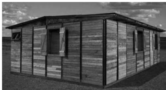
Figura 4 -Jean Prouvé, casa de madera, Lorena, 1945.