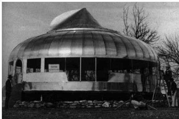
Figura 2 -Buckminster Fuller, casa Dymaxion, 1929.