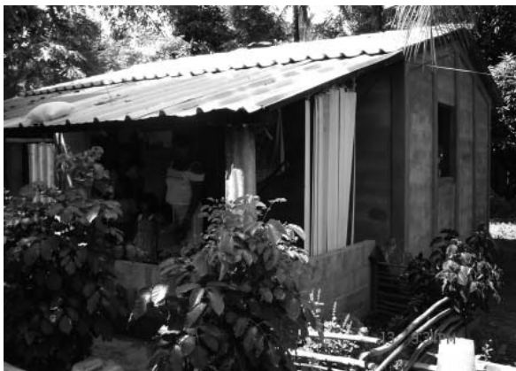
Figura 6 -Casa construida por FUNDASAL, con techo de tejas de cemento en El Salvador.