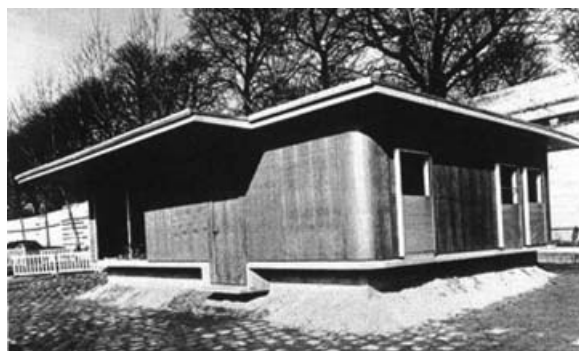
Figura 5 -Jean Prouvé, "casa de los días mejores", 1956.